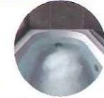
実験条件: マイクロバブル入浴とさら湯入浴の前後に前腕部の角質水分量を測定。被験者: 成人女性15名。検証製品: マイクロバブルバスユニット(UF-MBU3)

東京都市大学人間学部教授 早坂信哉先生からのコメント マイクロバブル入浴は、湯上がり後も肌への温浴効果や血流量が維持され角質水分量の低下を抑えられることが期待できます。マイクロバブル入浴を習慣化して保湿化粧品も活用すれば、しっとりとしたうるおい肌につながるが見込めます。