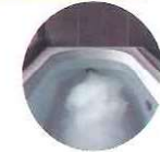
実験条件: マイクロバブル入浴とさら湯入浴の前後に生体情報(心拍と血圧)を計測。被験者: 成人男女12名。検証製品: マイクロバブルバスユニット内蔵ふろ給湯器(RUF-UME2406AW)

慶應義塾大学理工学部教授 満倉靖恵先生からのコメント マイクロバブル入浴は、さら湯入浴と比べてよりリラックスし、ポジティブな気持ちで入眠前の時間を過ごせる可能性があります。マイクロバブルが、入浴の価値を広げる取り組みに期待しています。